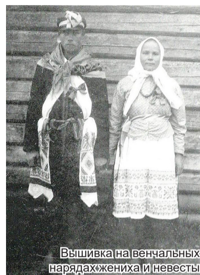
Вышивка на венчальных нарядах жениха и невесты

Молодые женщины носили праздничные передники ярких цветов больше для красоты. Также в состав праздничного девичьего костюма входили передники