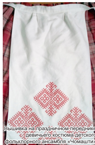
Вышивка на праздничном переднике девичьего костюма детского фольклорного ансамбля «Чомашти»